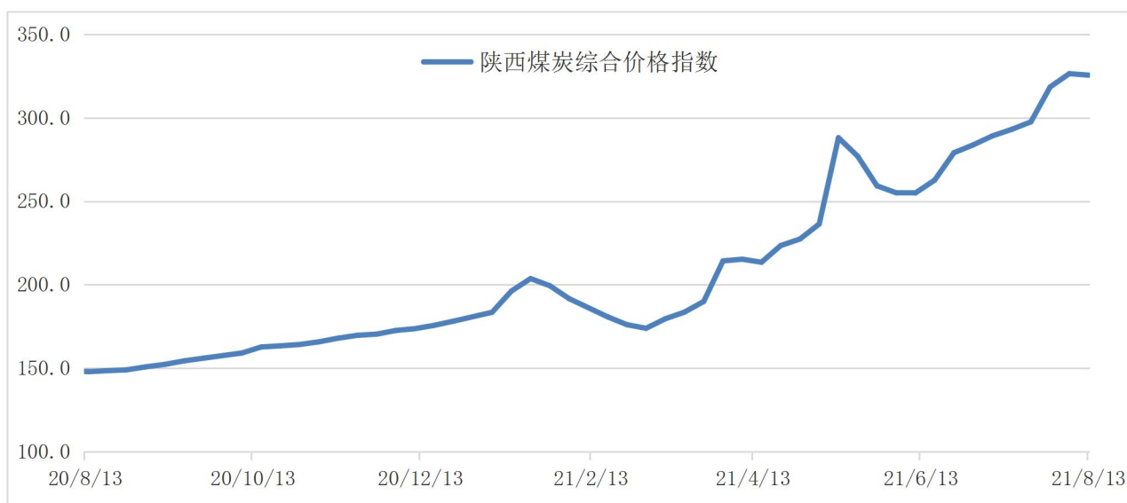
图 1: 综合指数走势图